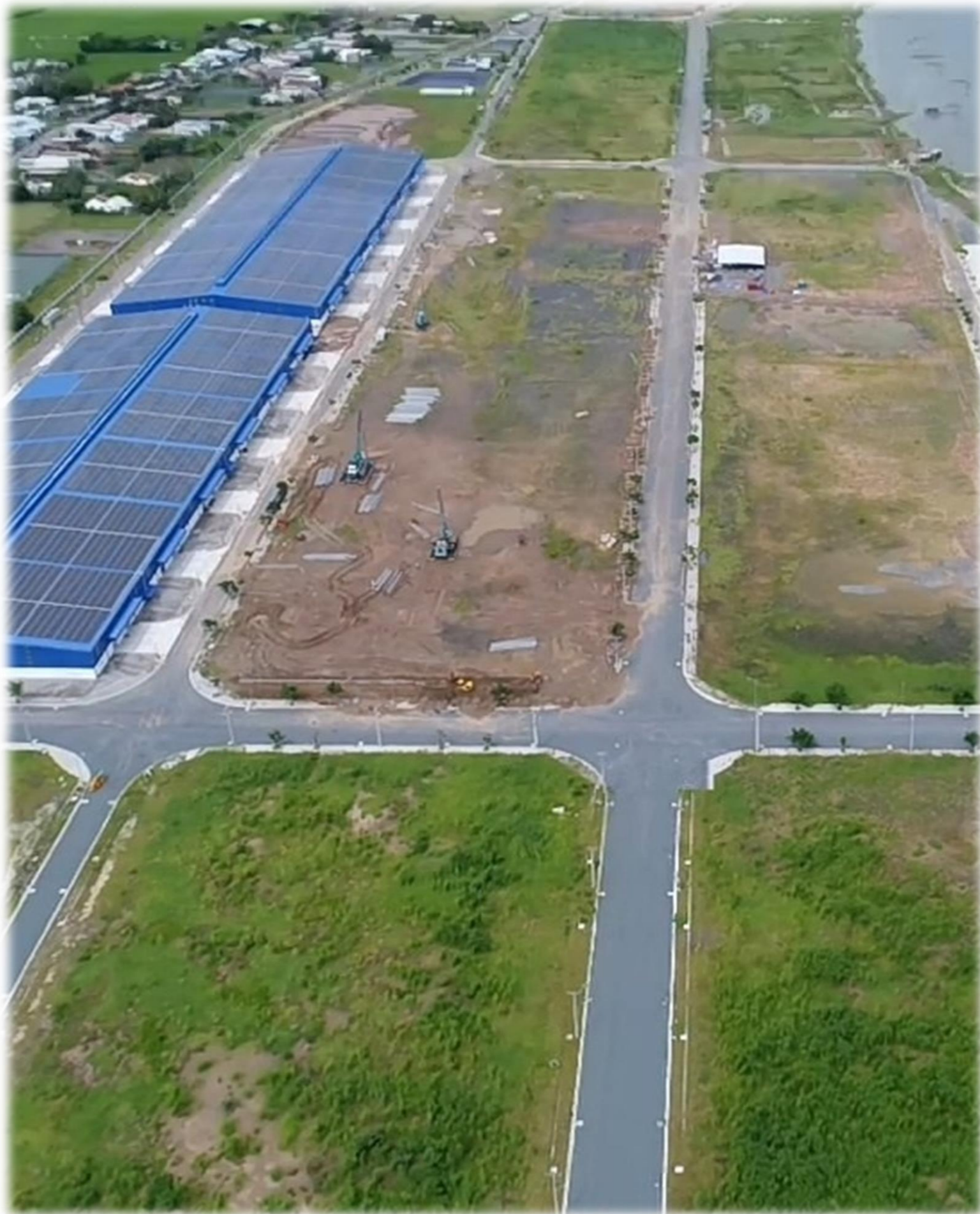
Hạ tầng công nghiệp